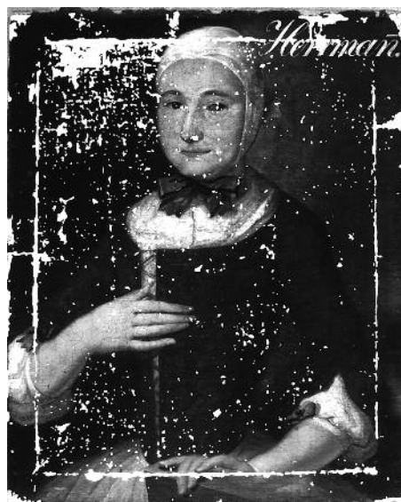
Bildoberfläche von GS 441 im gekitteten Zustand, vor der Retusche